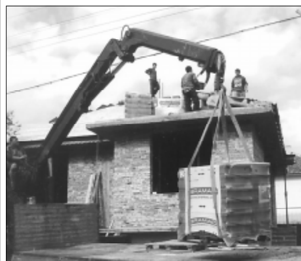
Строи се, дявол да го вземе, въпреки всичко строи се. Кой каквото ще да мисли, но за добро е, не само за стопаните на дома, но и за всички нас, гражданите на града. Така е било и така ще бъде, когато се съгражда, а не се руши.