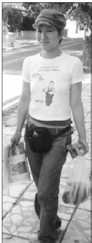
Необичайно, но факт. Туристка от далечна Япония в Малко Търново. Още по-впечатлително е, че тя е с вестник „Странджа“ в ръка.

Баща ми изживяв труден и не до там равен път, но остави диря след себе си. „Голям човек беше дядо Иван“ - казват тези, които го познават, „един кръстат странджански дъб“.