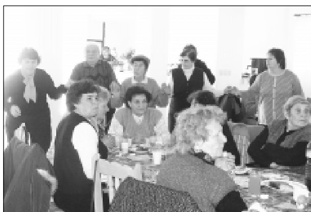
Момент от тържеството, състояло се в Дневния център - Малко Търново.