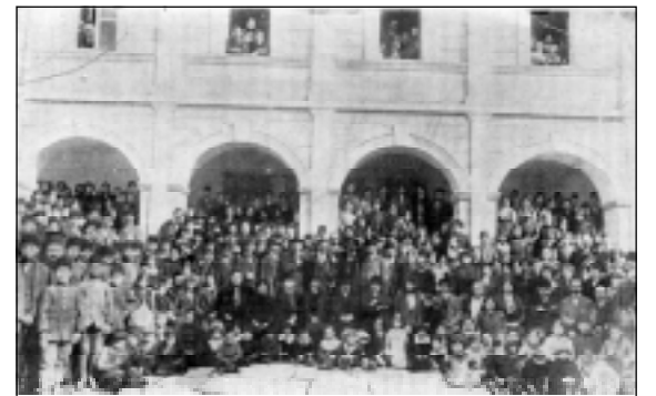
Подслонените в българската католическа гимназия в Одрин.

Сега трябваше да се намери начин, за да се изпратят тия хора в България. Заведението се застъпва, снабдява ги с паспорти. Но това още не