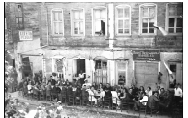
Празненство по повод деня на освобождението на Малко Търново.