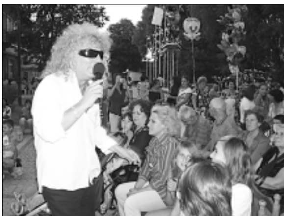
Естрадният певец, артистът Теди Генов, роден в Малко Търново, очарова публиката