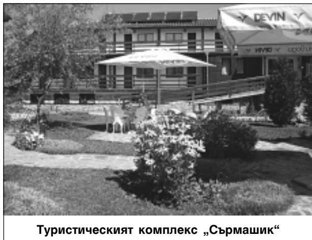
Туристическият комплекс „Сърмашик“

Продължихме разходката си из селото, за да усетя още по-убедително