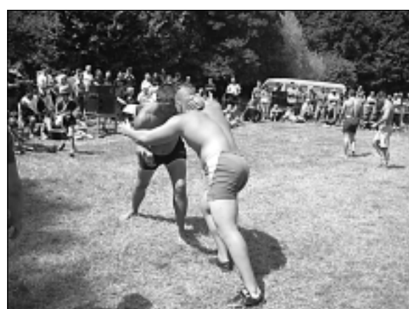
Народни борби в м. Черногорово по време на традиционния за града панаир