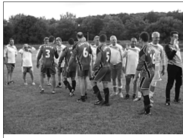
Много емоции предизвика футболната среща между отборите на ФК „Странджа“ и този на ветераните