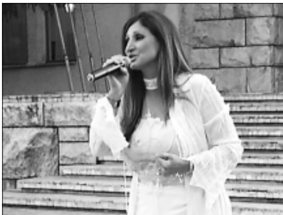
Популярната фолклорна певица Поли Паскова бе една от изненадите на вечерите