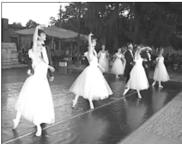
Балетът на Бургаската опера бе гост на летните празници на града ни за 4-ти път