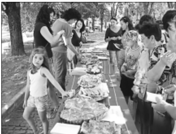
„Шарена трапеза“ - кулинарна благотворителна изложба по проект „Агора“