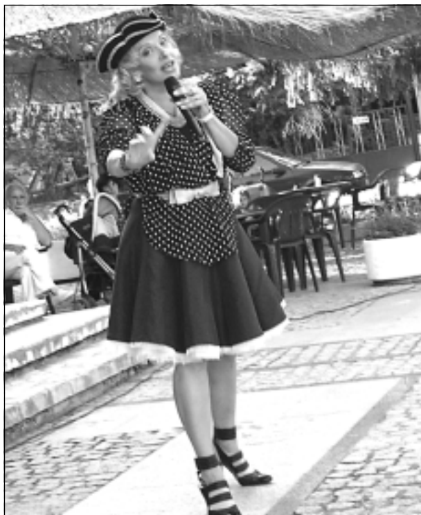
Заслужилата артистка на Русия Наталия Сорокина дари публиката с много настроение