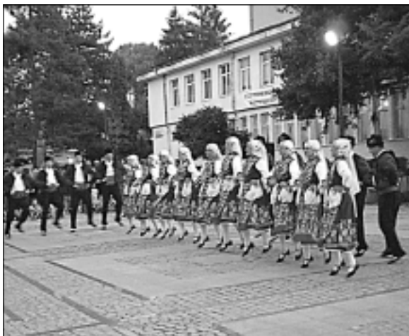
Ще се помни концертът на професионален фолклорен ансамбъл „Странджа“