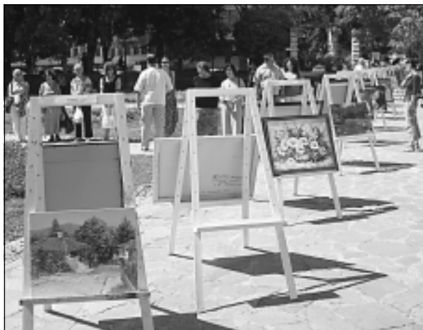
Живописната изложба, уредена при закриване на пленера